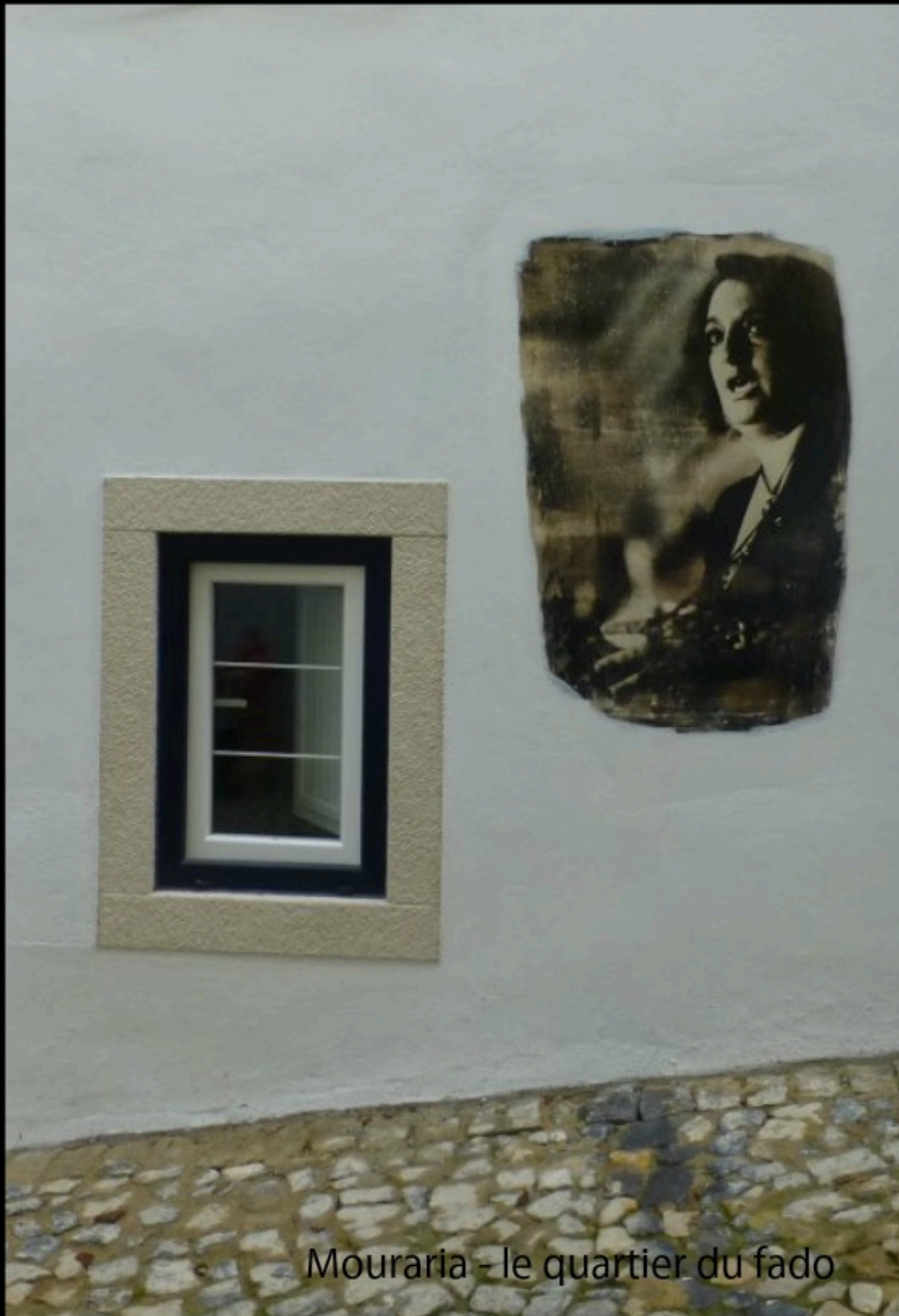
Mouraria - le quartier du fado

Bateram fui abrir era a saudade vinha para falar-me a teu respeito entrou com um sorriso de maldade depois sentou-se à beira do meu leito