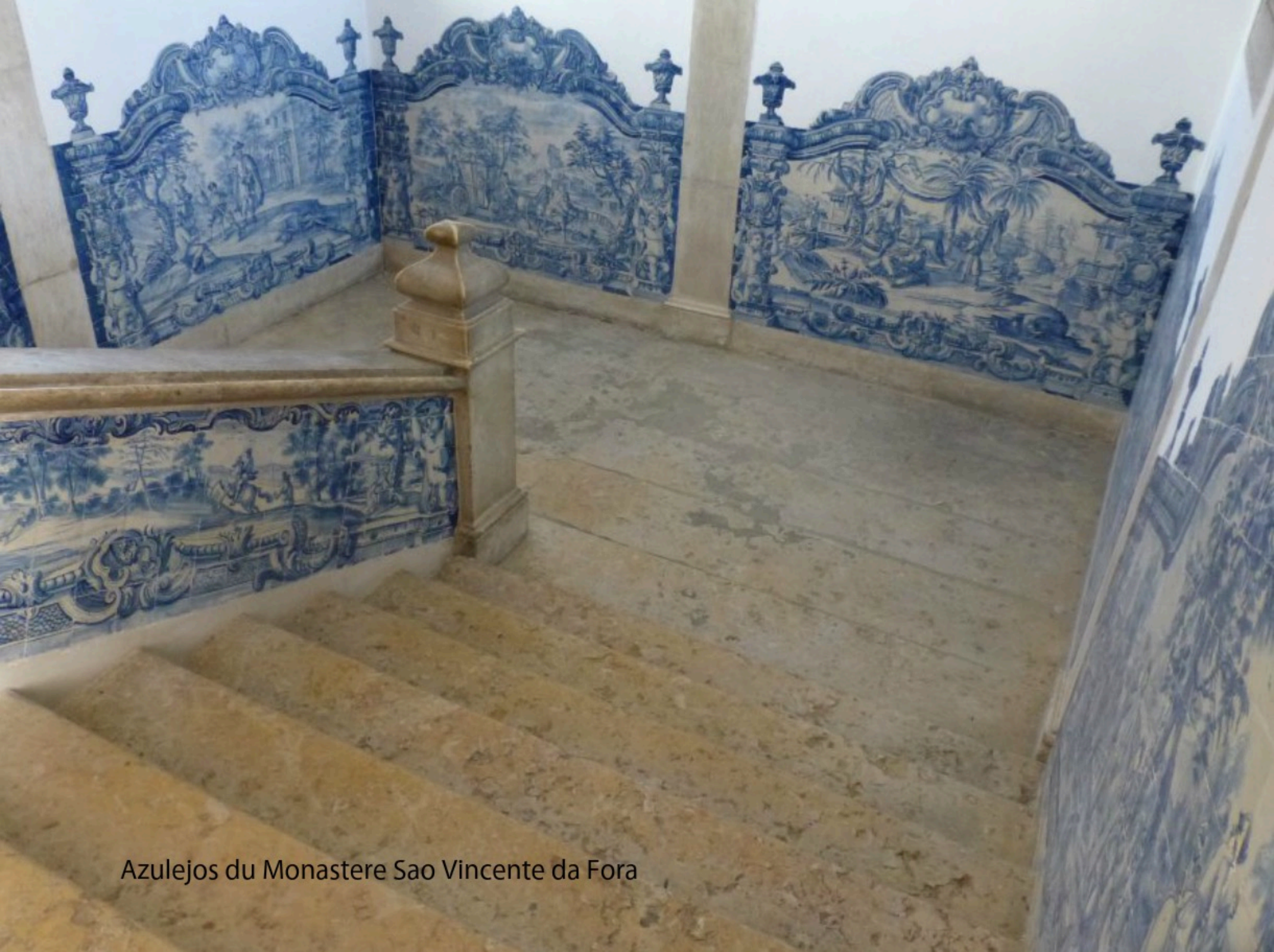
Azulejos du Monastere Sao Vincente da Fora