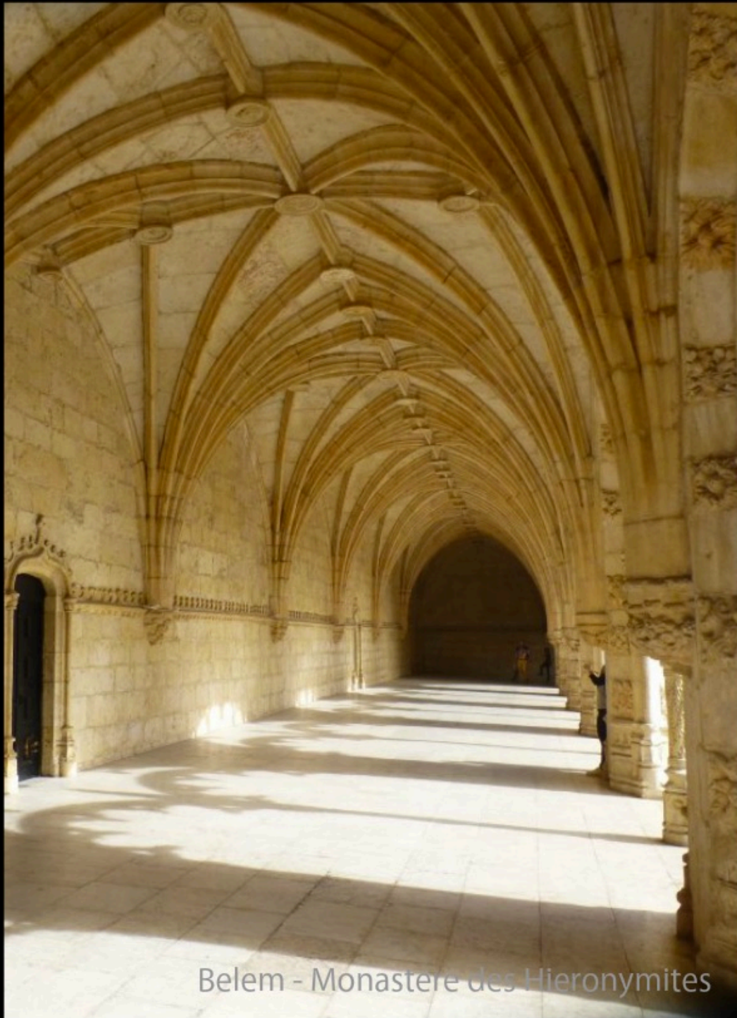
Belem - Monastere des Hieronymites