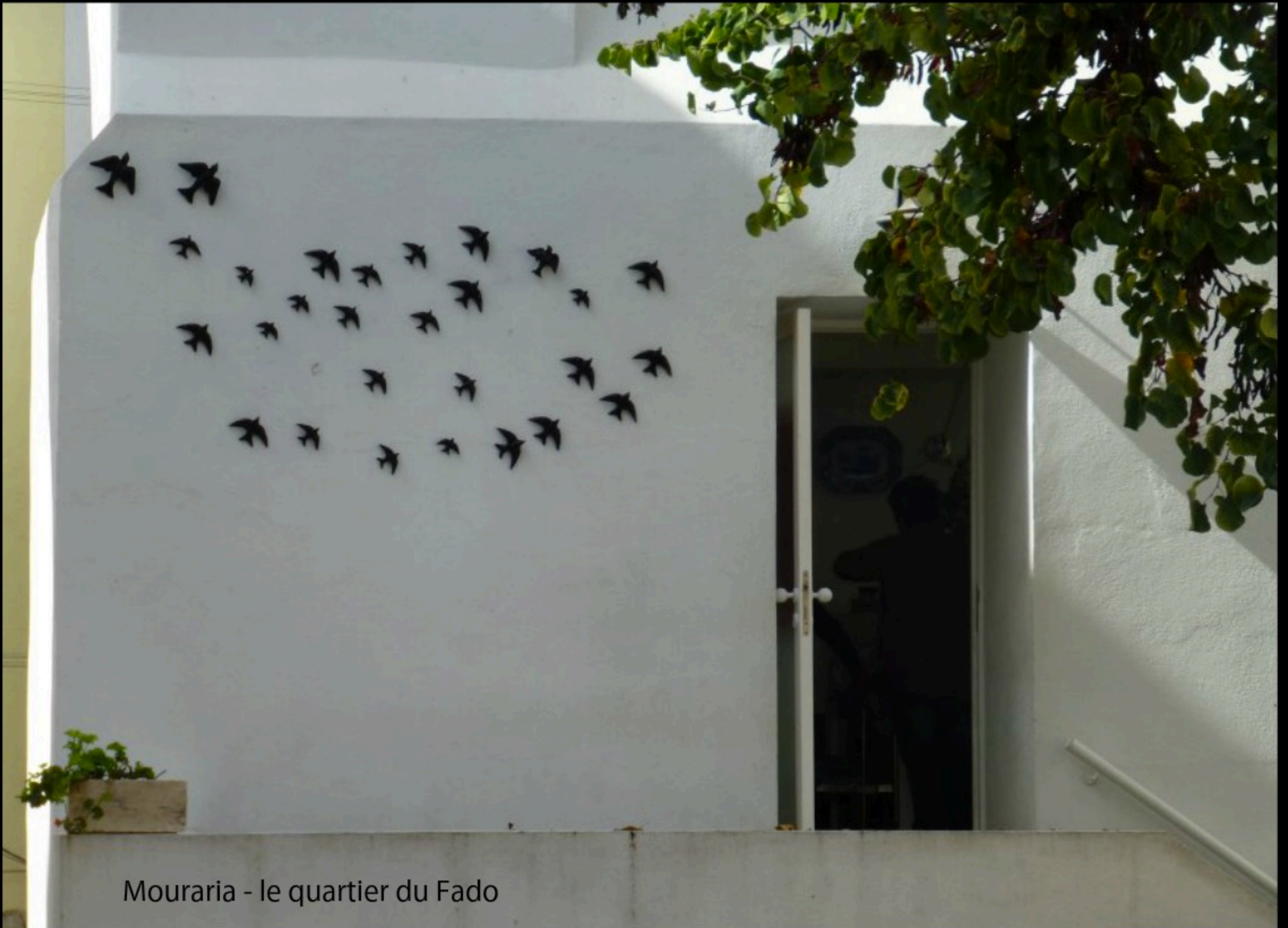
Mouraria - le quartier du Fado