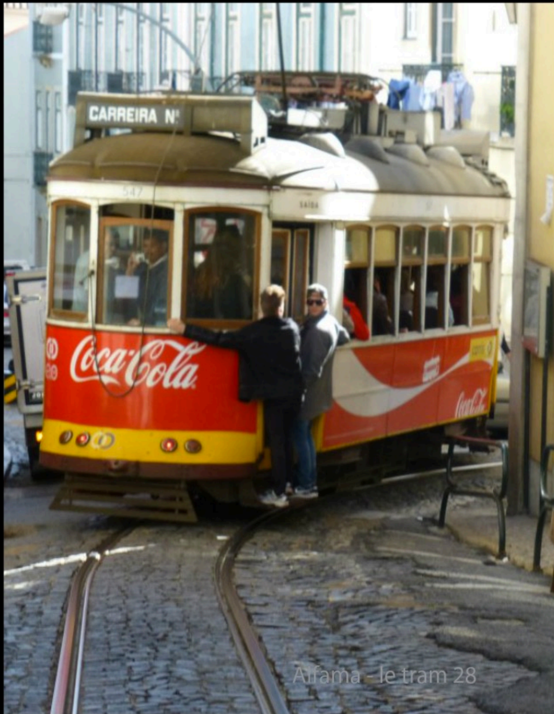
Afama - le tram 28