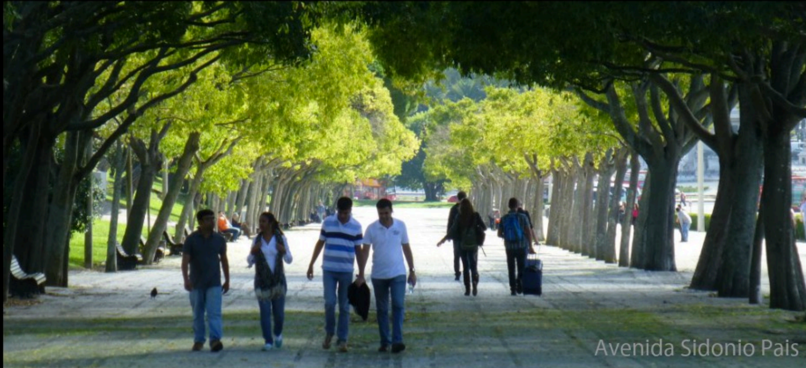
Avenida Sidonio Pais

Jamais personne ne s'est perdu. Tout est vérité, et chemin.