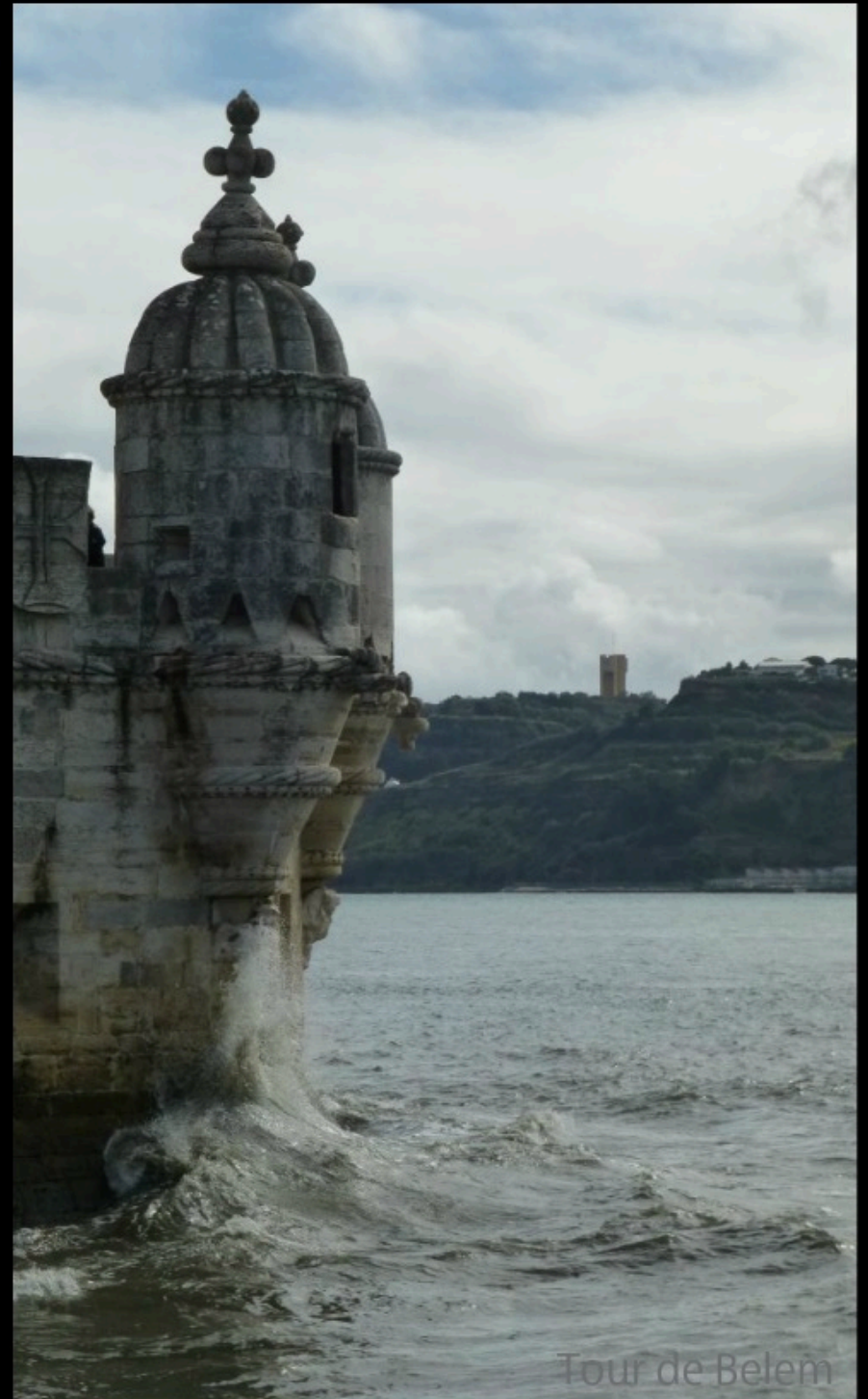
Tour de Belem