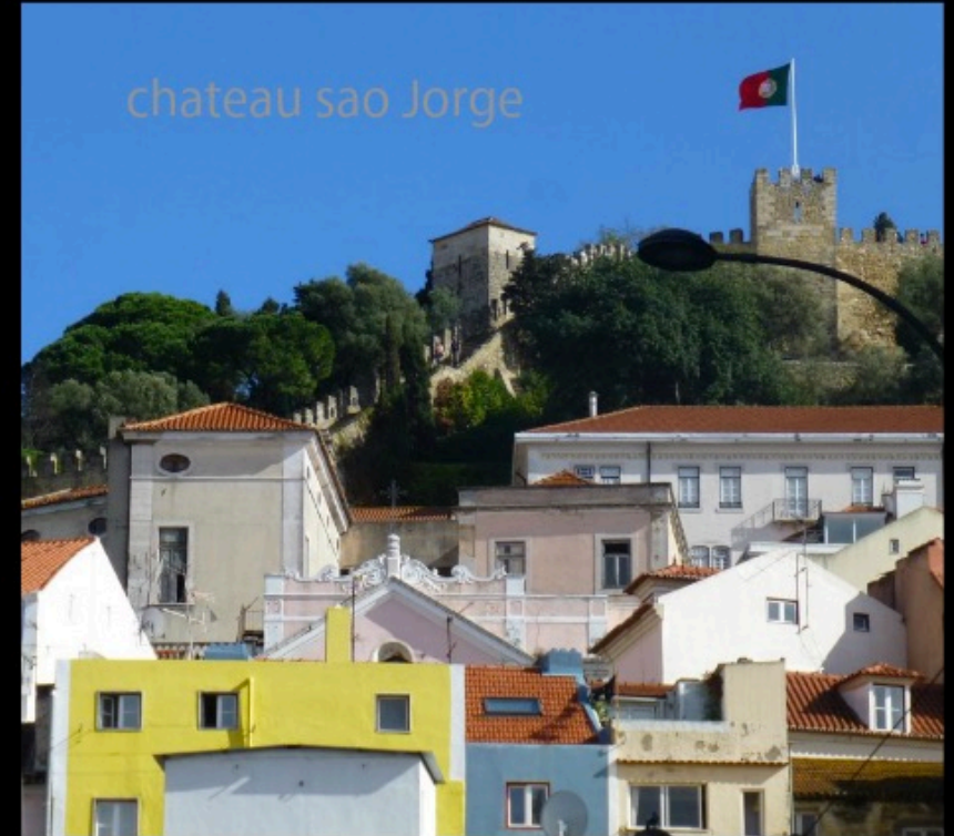
chateau sao Jorge

Les dômes, les monuments, les vieux châteaux font saillie au dessus du fouillis de maisons