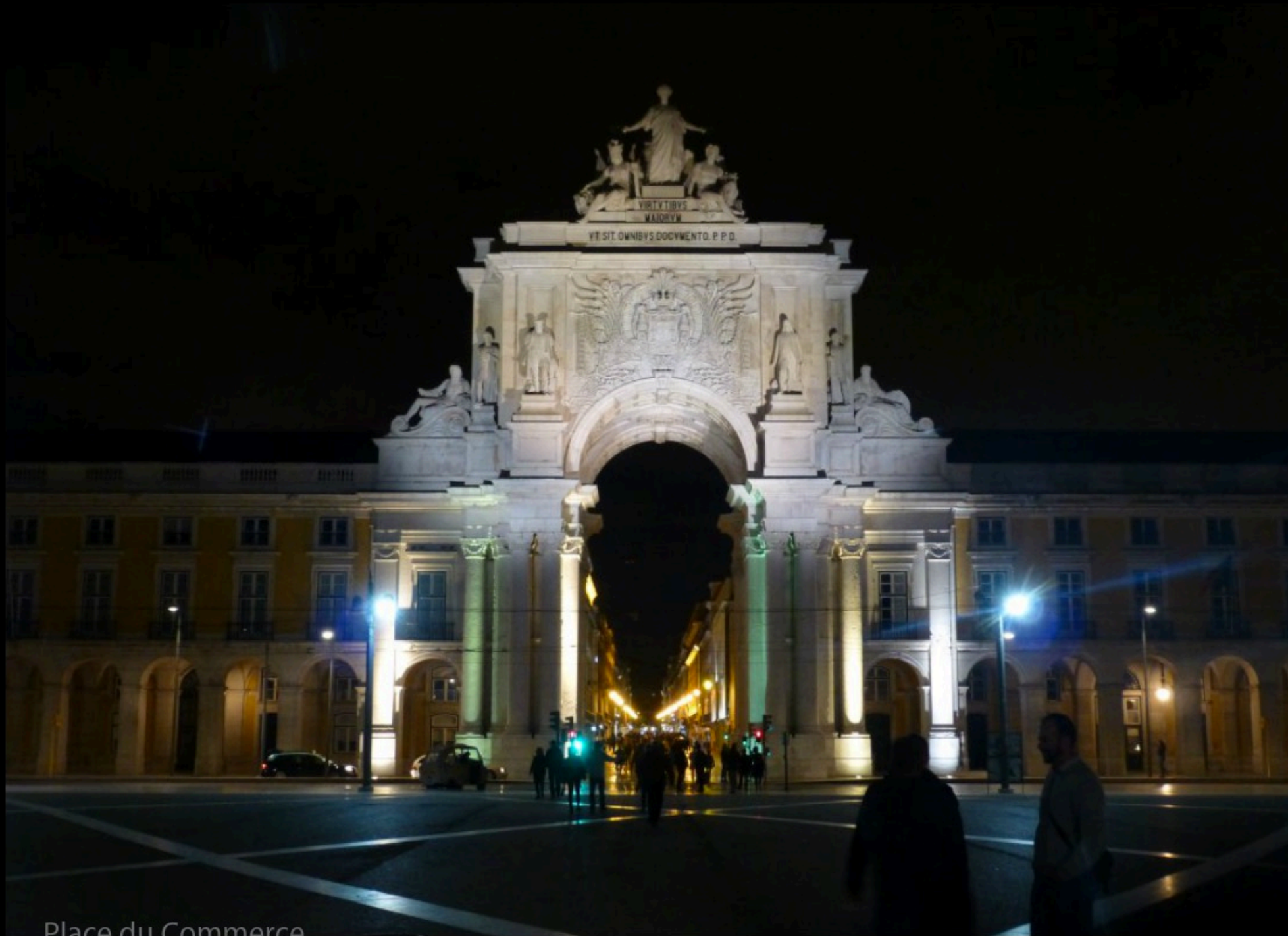
Place du Commerce