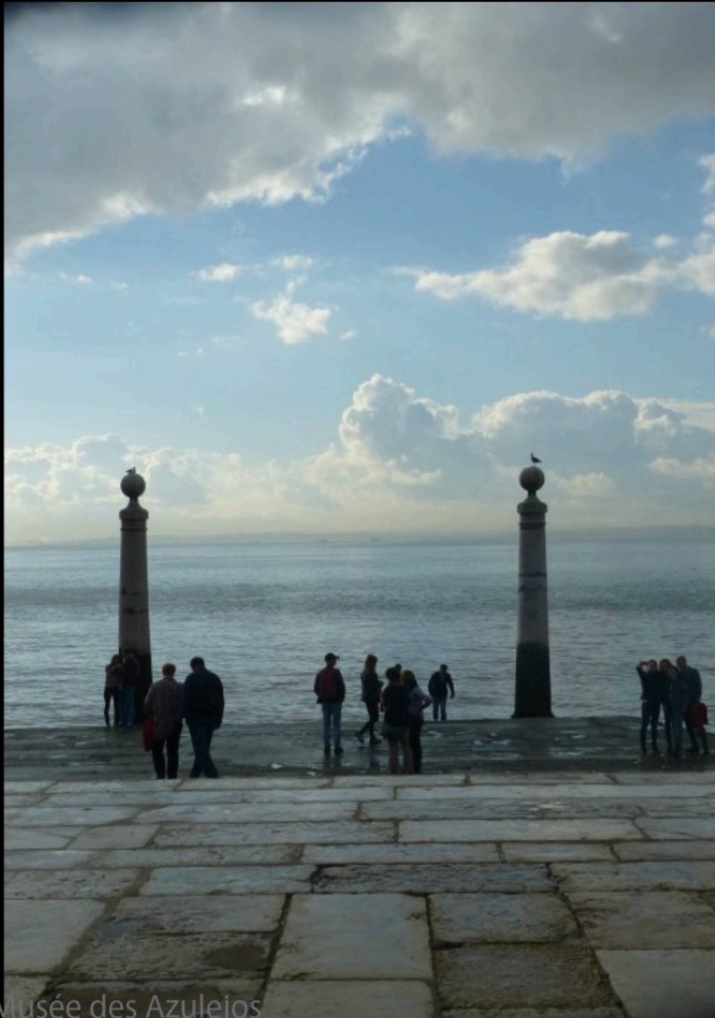
Musée des Azulejos

Je ne suis rien. Je ne serai jamais rien. Je ne peux vouloir être rien. A part ça, je porte en moi tous les rêves du monde.