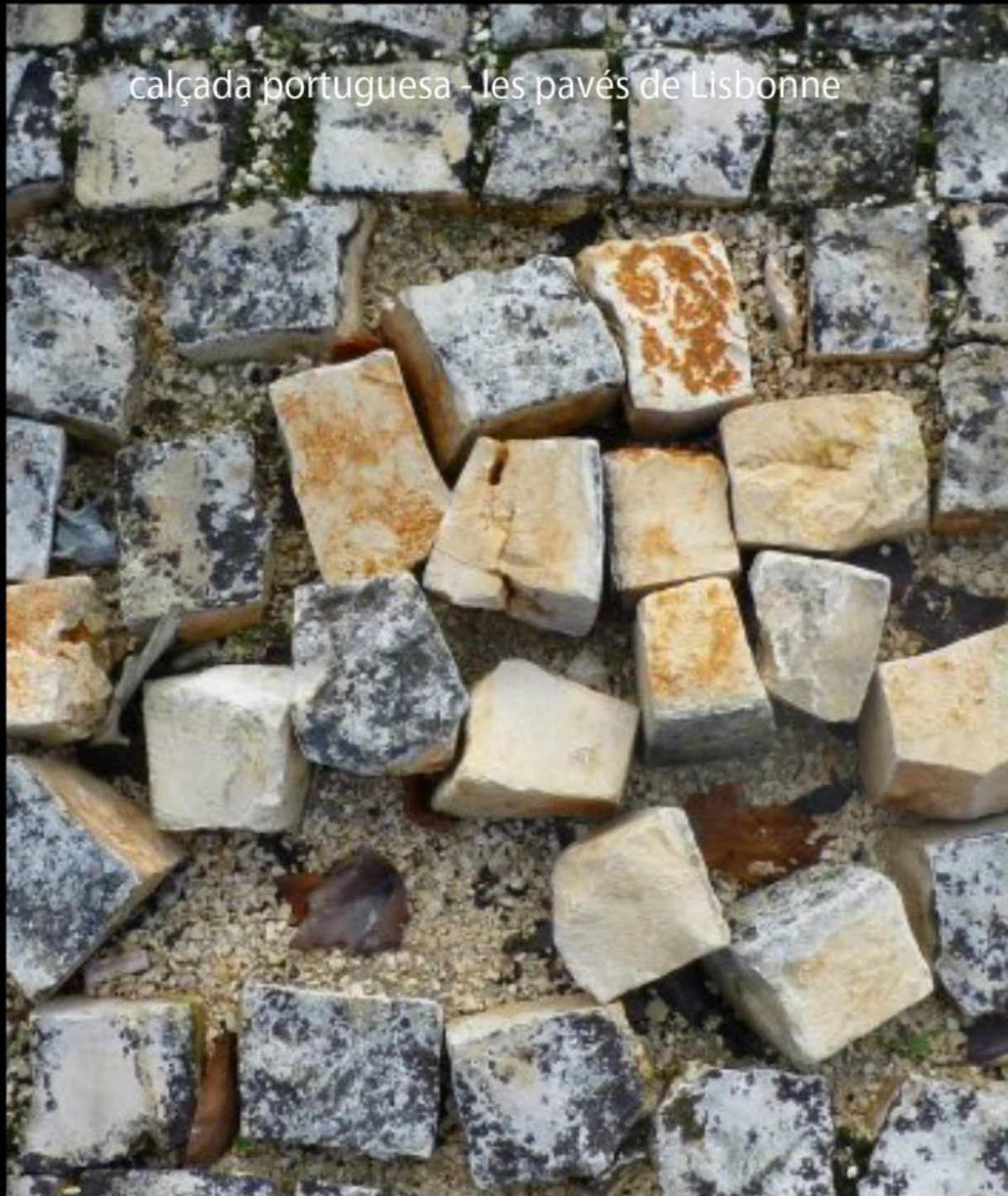
calçada portuguesa - les pavés de Lisbonne