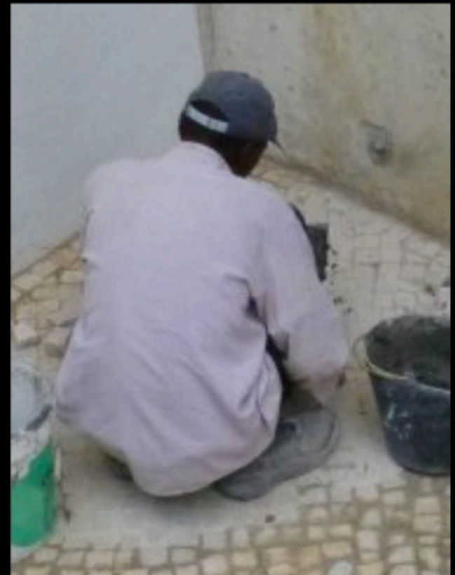
De cócoras, em linha (...), Com lentidão, terrosos e grosseiros, Calçam de lado a lado a longa rua