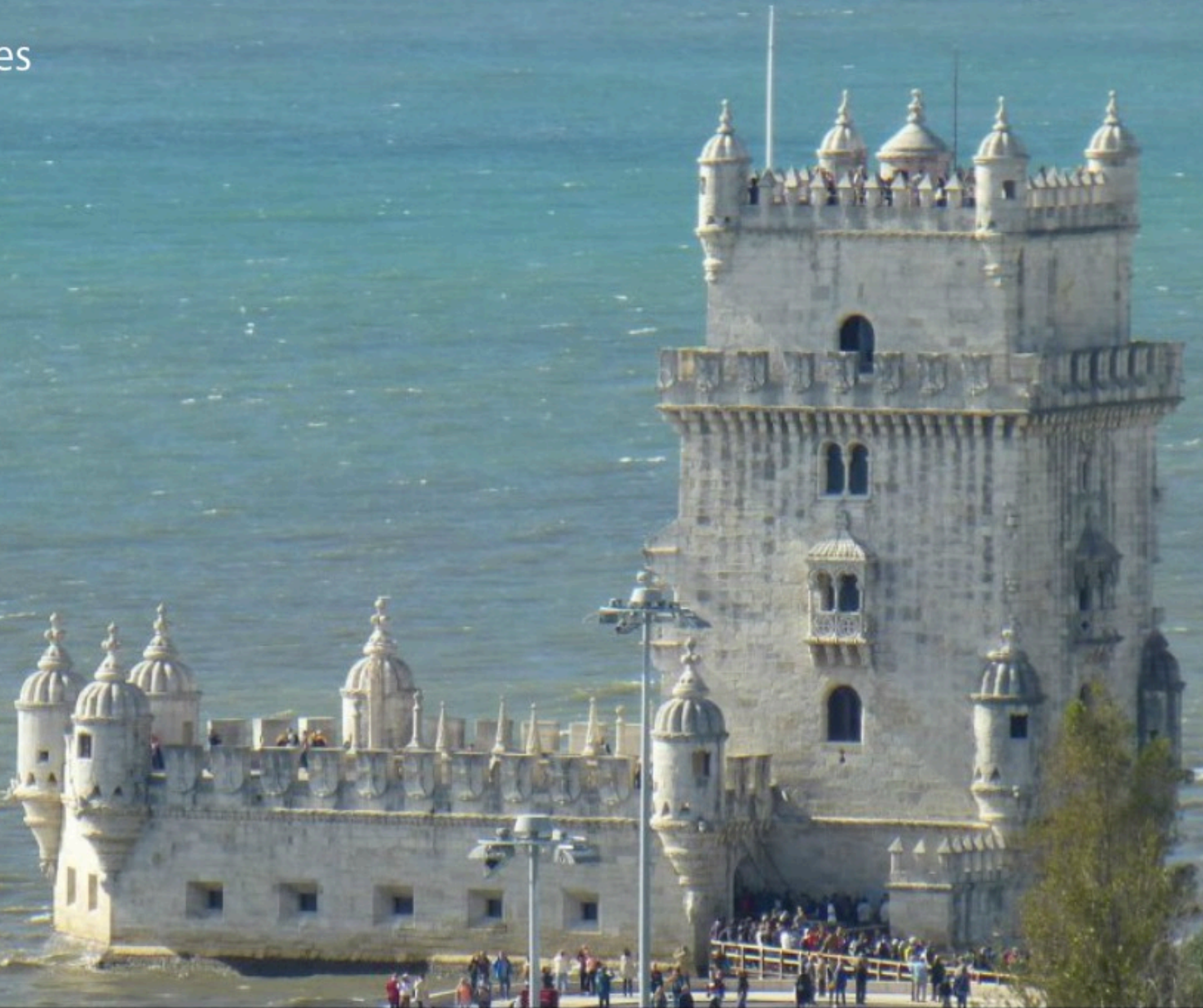
Tour de Belem